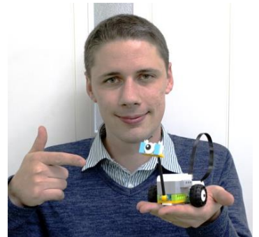
ジョシュア先生(ニュージーランド出身)

Building/Poster creation-ロボット/ポスター作成 Presentation